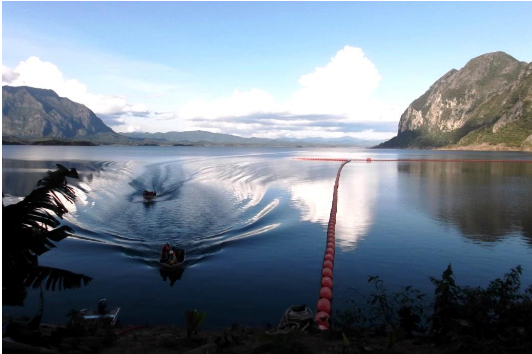
ภาพประกอบ 3 เขื่อนไฟฟ้าน้ำเทินหินบูน ภาคชยาว เมืองคำเกิด แขวงบอลิคำไซ สาธารณรัฐประชาธิปไตยประชาชนลาว