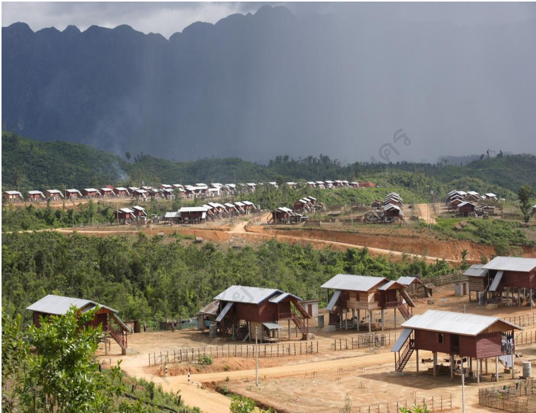
ภาพประกอบ 4 บริบทชุมชนโยกย้าย เมืองคำเกิด แขวงบอลิคำไซ สาธารณรัฐ ประชาธิปไตยประชาชนลาว

มิลลิเมตร ฤดูหนาวเริ่มจากท้ายเดือนพฤศจิกายนและไปสิ้นสุดที่ปลายเดือนมีนาคม อุณหภูมิเฉลี่ยอยู่ระหว่าง 5 ถึง 10 องศาเซลเซียส ร้อนที่สุดในช่วงเดือนมีนาคมถึงเมษายน อุณหภูมิสูงสุดวัดได้ 40 องศาเซลเซียสในเดือนเมษายน เห็นได้ว่าประเทศลาวได้แบ่งเขต ภูมิอากาศออกเป็น 3 เขตที่แตกต่างกัน